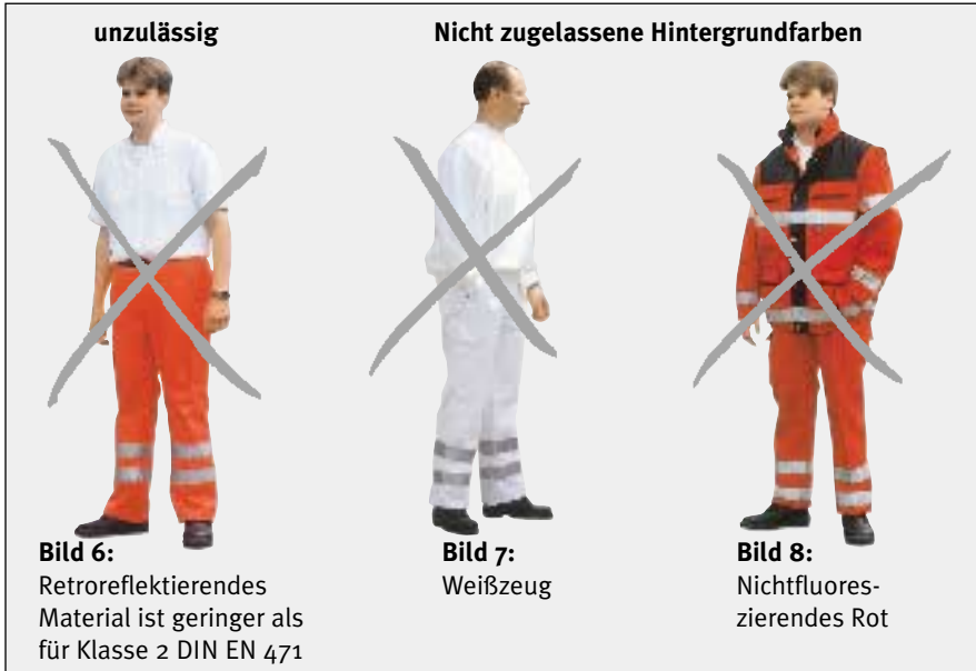
Bild 6: Retroreflektierendes Material ist geringer als für Klasse 2 DIN EN 471