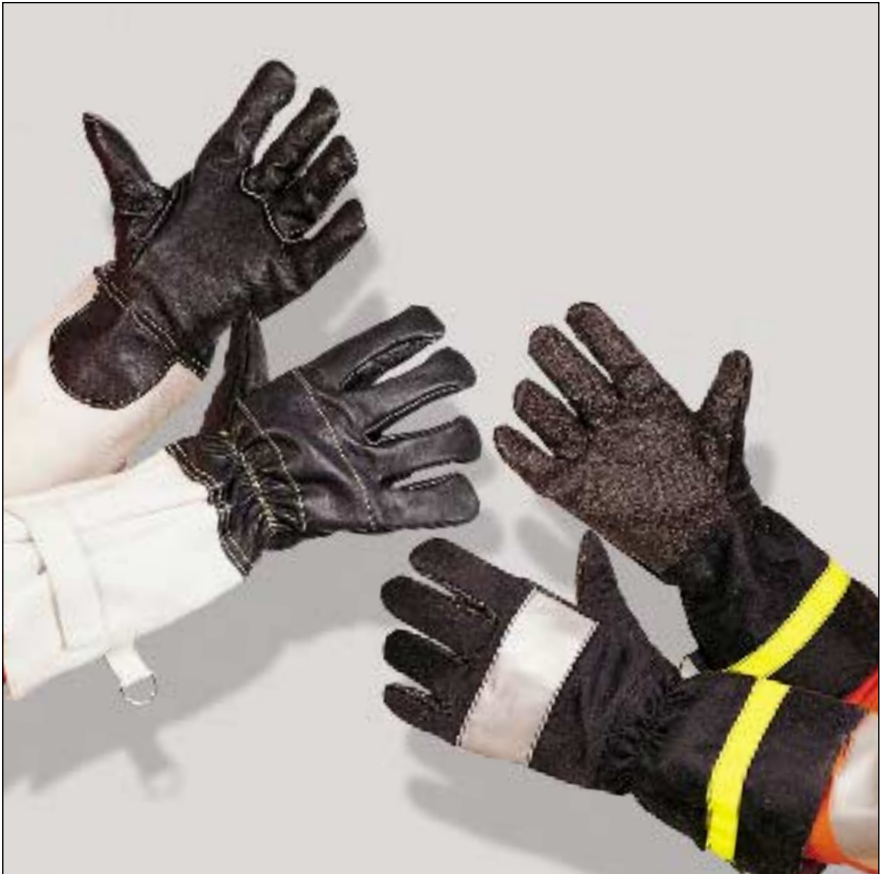
Bild 13: Feuerwehrschutzhandschuhe aus Leder oder textilem Gewebe, gummiert

Es genügt, wenn pro Mitglied der Fahrzeugbesatzung ein paar entsprechende Handschuhe auf dem Einsatzfahrzeug vorgehalten wird. Handschuhe zum Schutz vor Infektionen siehe Punkt 4.5.