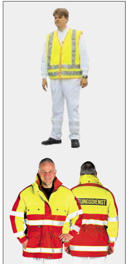
Bild 11: Fluoreszierender Farbanteil und retroreflektierendes Material genügt Klasse 2 DIN EN 471