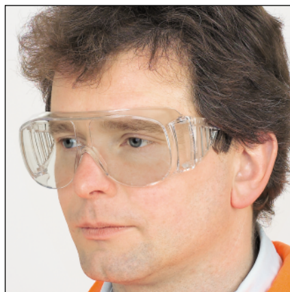
Bild 2: Schutzbrille mit indirekter Belüftung und seitlichem Spritzschutz

Aus Gründen der Hygiene und im Hinblick auf die anzustrebende persönliche Verantwortlichkeit des Trägers für den Helm bzw. der ordnungsgemäßen Pflege sollte dieser für die jeweilige Person konkret bestimmt sein. Wird dagegen auf dem Einsatzfahrzeug die notwendige Anzahl von Helmen für die Besatzung durch mehrere Personen (wechselnde Besatzung, Schichtdienst) vorgehalten, muss die erforderliche Hygiene z.B. durch die Verwendung von unter dem Helm zu tragenden Papierschonmützen sichergestellt sein.