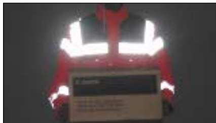
Bild 9: Verbesserte Nachtauffälligkeit durch zusätzliche Vertikalstreifen. Die Horizontalstreifen können durch Gegenstände oder beim Bücken verdeckt werden.